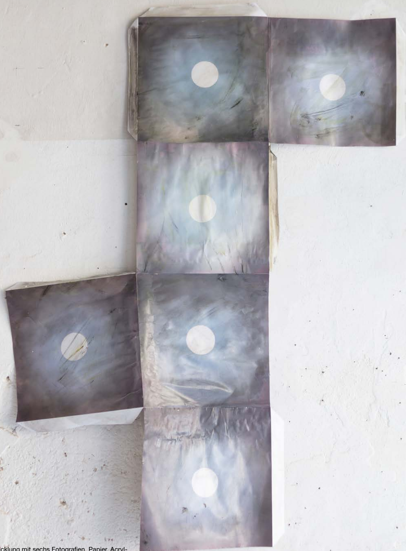
Abwicklung mit sechs Fotografien, Papier, Acrylbinder, Pigment, 118x88cm, 2019